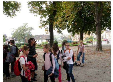
Pique-nique sous un chapiteau